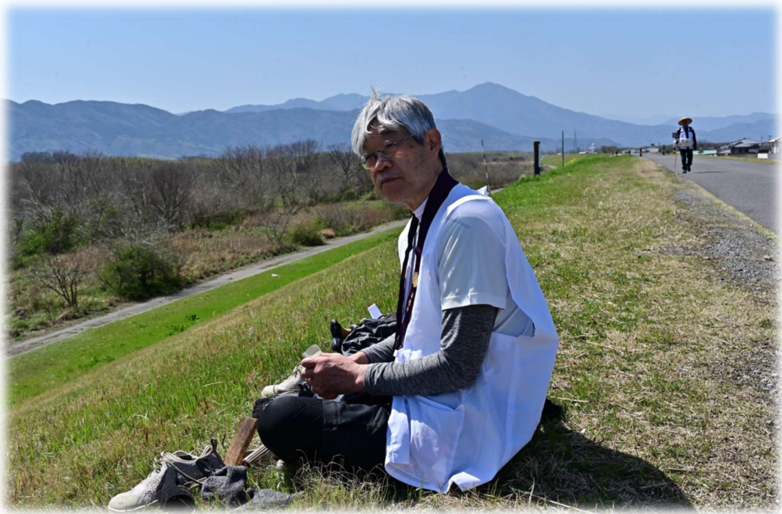
一級河川吉野川左岸