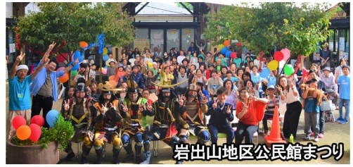
岩出山地区公民館まつり