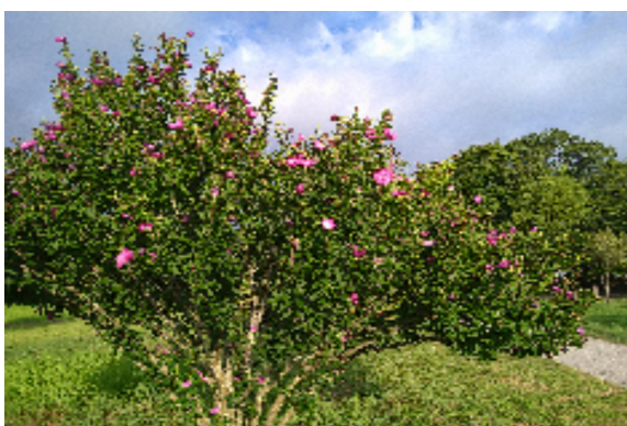
長命ヶ丘南緑公園内のムクゲ（木槿）

《お話しを聞かせて下さい》 みなさんの趣味活動等の「こんなことで楽しんでいきます」を大募集します。この新聞で、取り上げてみんなで楽しみませんか。ご連絡をお待ちしています。