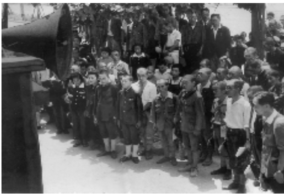
玉音放送に聴き入る人たち

◆戦後七八年。昭和から平成、令和と時代が移り、戦争体験者が急速に減っています。戦後生まれの人口が全体の八割を超え、戦争は「記憶」から「歴史」へと変わりつつあります。◆こうした中で、戦争の惨禍を次代に伝えていく取り組みが重要になっていきます。◆自分の親から聞いた話を孫に伝える等、現在の高齢者には大切な役割があるように思います。