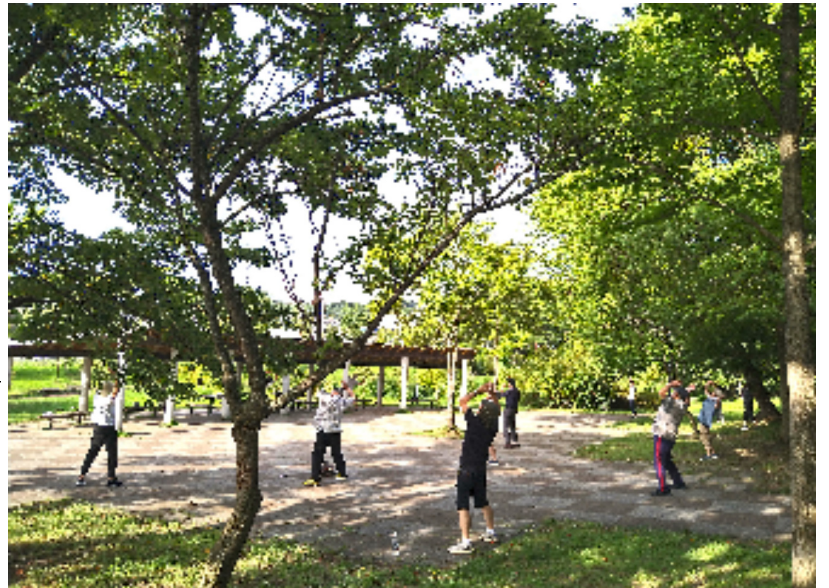
八月七日 長命ヶ丘南緑地公園で毎日行われているラジオ体操の様子。