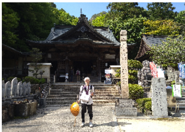
高野山奥の院御朱印

◆歩きお遍路は、日数が多く、その分費用もかさみ、一番贅沢なお遍路とも言われています。 一日一万円掛かると言われています。