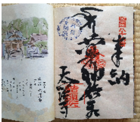
八十八番札所大窪寺御朱印

◆実際、そのくらいは必要でした。八十八ヶ寺を巡拝するだけで五十日。加えて、一番札所霊山寺と高野山奥の院へのお礼参りに四日程の日数を必要とします。更に往復の交通費や装備も必要になります。これだけの時間とお金を掛けて何が得られるのか。これからの暮らし方で考えてみたいと思つています。