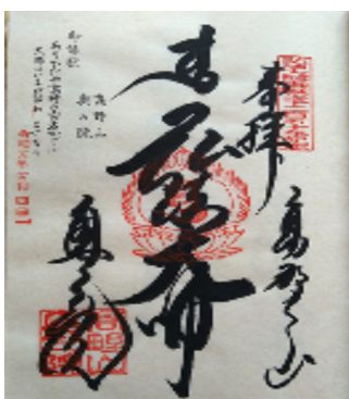
令和五年五月四日