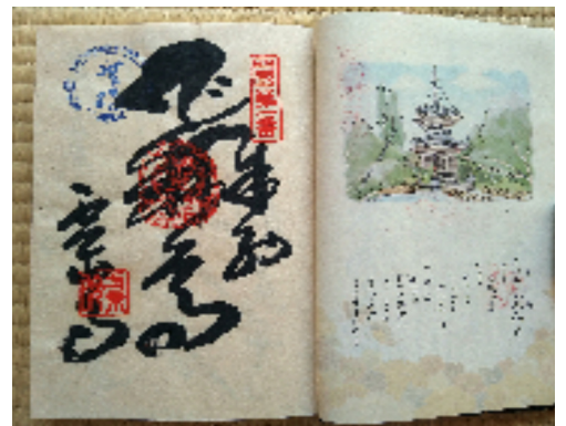
一番札所霊山寺の御朱印

◆歩きお遍路は、年間三千人程度と言われています。昨年七月からの統計で、私は九七八人目でした。この内、通し打ちの人数は、その半数以下ではないかと語っています(お遍路交流センター職員)。 歩きお遍路は、魅力的ではありませんが、だいぶハードルが高いというのも現実のようです。歩きお遍路の所要日数は、五十日前後と言われ、私は五十日掛かりました。